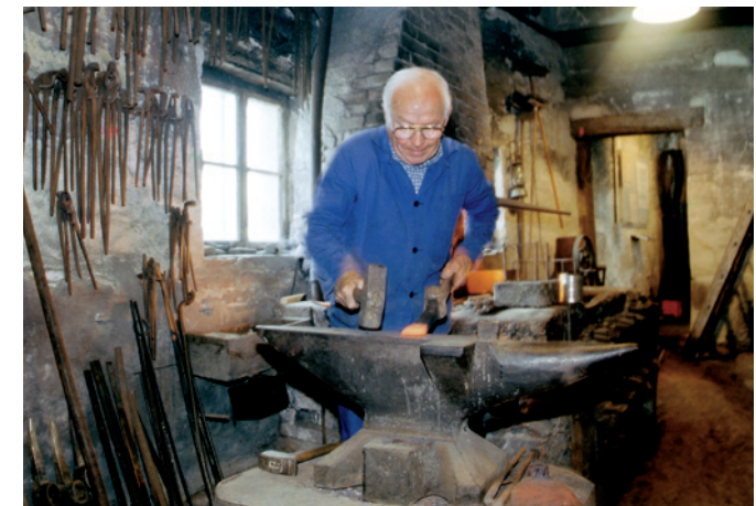
Amboss 2): Schmieden einer Metallschneide auf einem Amboss

streckte und mit reicher Innenausstattung versehene »Span. Saal« war der größte Saal der dt. Renaissance und zählt zu den bedeutendsten frei stehenden Saalbauten der Renaissance überhaupt. Das Unterschloss beherbergte in der Kornschütt Stallungen und Bibliothek und in weiteren Gebäuden Waffensäle, die Kunst- und Wunderkammer (Malerei, Plastik und Kunstgewerbe des 16./17. Jh.) und das Antiquarium zur Aufstellung von Plastiken. Die von FERDINAND II. angelegten wertvollen Ambraser Sammlungen , die ab etwa 1580 im Unterschloss aufgestellt waren und das erste Museum der Neuzeit darstellen, wurden nach seinem Tod an Kaiser RUDOLF II. verkauft, aber erst 1805 nach Wien gebracht. Zu ihnen gehören u. a. das Ambraser Heldenbuch , im Auftrag MAXIMILIANS I. zw. 1504 und 1516 von HANS RIED geschrieben. Es umfasst 25 Werke (u. a. Dietrichepik, »Nibelungenlied«, »Kudrun«, HARTMANN'S »Erec« und »Iwein«, ULRICH VON LICHTENSTEIN'S »Frauenbuch«, »Moriz