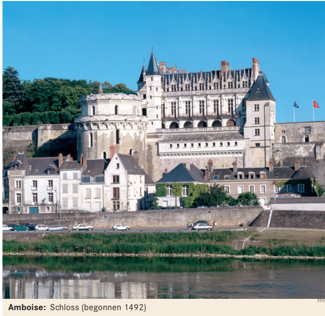
Amboise: Schloss (begonnen 1492)

Ambohimanga , Stadt in Madagaskar, nördlich von → Antananarivo.