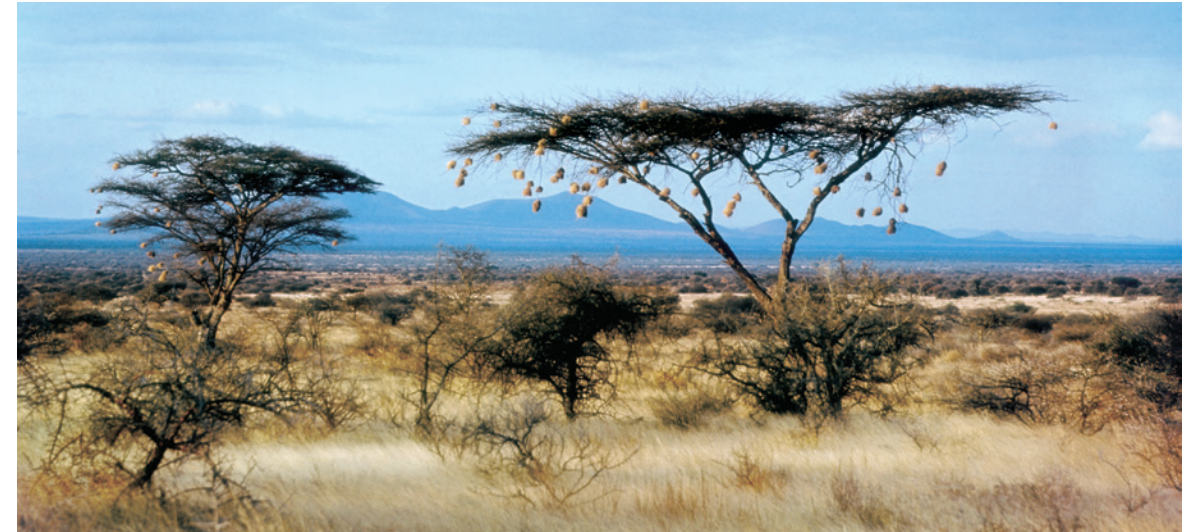
Amboseli-Nationalpark: Savannenlandschaft im Amboseli-Nationalpark

Die ebene A.-Bahn (a) ist gehärtet. Auf (runden oder vierkantigen) Hörnern (b) können Stäbe gebogen und Ringe oder kurze Rohre geschweißt werden. Zum Einstecken der Hilfswerkzeuge dienen ein oder zwei Löcher (c), zum Stauchen langer Werkstücke mitunter ein Staucher. Schwere A. ruhen auf einem z. T. in der Erde eingegrabenen Holzklotz, dem A.-Stock . – Bereits in der Alt- und Jungsteinzeit wurden bei der Verarbeitung von Feuerstein Steinblöcke als A. verwendet. In der Bronzezeit benutzte man teils noch steinerne, teils auch bronzene A., unter denen neben einfachen Formen solche mit seilt. Horn (etwa zum Schmieden von Ringen) erscheinen. Seit der Hallstattzeit setzten sich allmählich eiserne A. durch. Der Schmiede-A. in seiner heutigen Form tritt im hohen MA. auf.